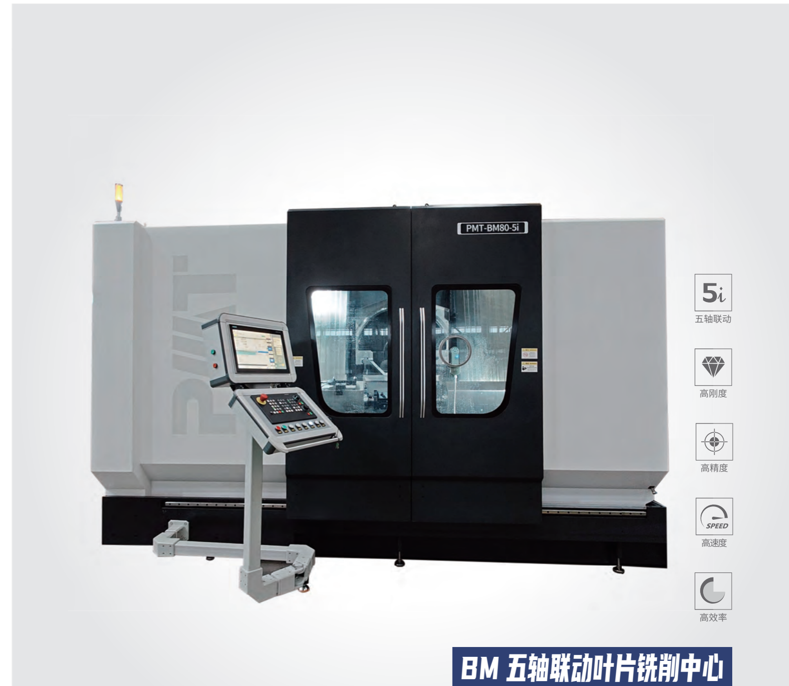
BM 五轴联动叶片铣削中心